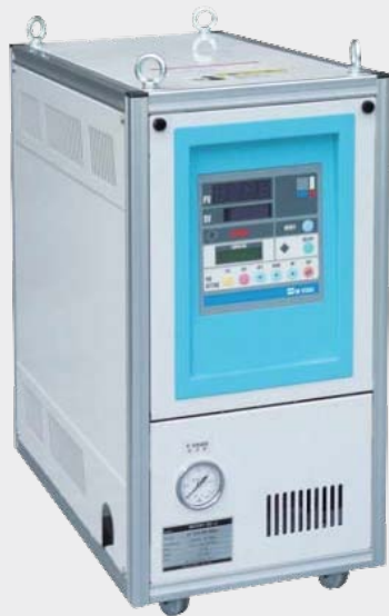
[ MCHH ]

水媒体のまま Max160°C迄の温調を可能にした金型温調機です。給水温度 +10 ~160°C、低温から高温まで高精度で安定した温調を実現、クリーンルーム等オイルを嫌う環境でも安心してご使用いただけます。