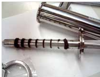
■ 磁力 13,500 ガウス ( 残留磁束密度 )