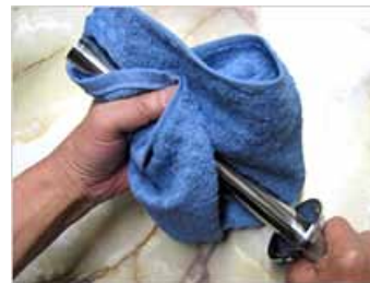
■ 簡単メンテナンス